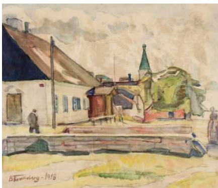
Balder Tomasberg. Sügisõhtu.

- tema tööd ei ole aegade segaduses kaduma läinud, neid on Tartu Kunstimuseumis, KUMU-s ja mujalgi