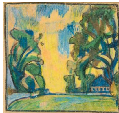
Balder Tomasberg. Paldiski vaade. (1918) /Tartu Kunstimuseum TKM TR 786 A 63 / /vikipeedia.ee/