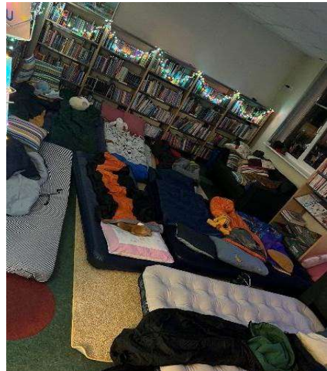
Magamistuba Raamatukoguööil Lagedil.