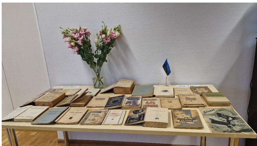
Vanema kirjanduse väljapanek Vaida raamatukogus

Ka neil oli väljapanek vanadest raamatutest, mis pärinesid alates 19. sajandist ning laste saalis sai tutvuda eri aegadest pärit aabitsatega.