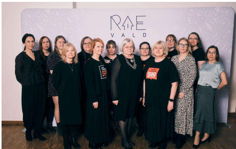
Rae valla raamatukogude töötajad raamatuaasta kontsertõhtul.

Rae valla raamatukogude raamatuaasta oli mitmekesine ja hästi kavandatud. Sündmused kaasasid eri vanuses inimesi, töid kokku kogukonna ja näitasid, et raamat on jätkuvalt oluline osa kultuurist ja igapäevaelust.