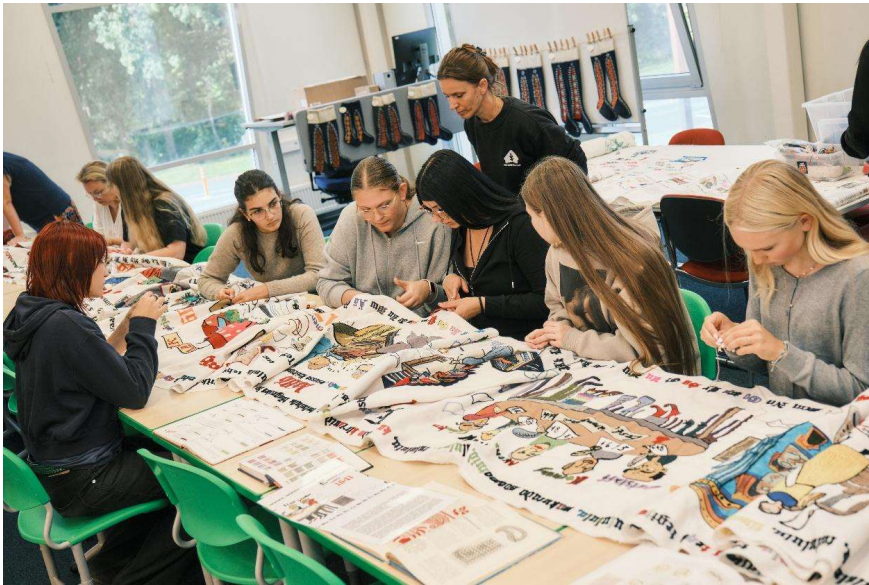
Raamatuaasta vaiba tikkimine.

Piibe Padari juhendamisel said tikkida kõik huvilised: omavalitsuse töötajad, raamatukoguhoidjad, koolilapsed, memme-taadi klubi, kohalike ettevõtete esindajad jt. Sündmus tõi kokku eri põlvkonnad ja taustad ühise eesmärgi nimel. Esimesel päeval löi meeleolu ka muusikaline kollektiiv Trio Naturale.